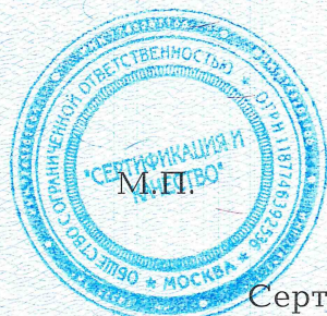
Схема сертификации: 1с.